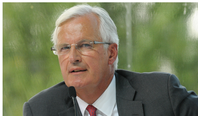
Michel Barnier, Premier ministre