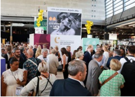
▲ Stand UNEC 2023.